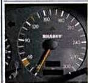
Der Tacho hat eine 30er Skalierung bis 3000 U/min. Echte Spitze: 2700 U/min

+ Temperamentvoller Motor, hervorragende Fahrleistungen, sichere Fahreigenschaften